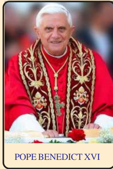
POPE BENEDICT XVI